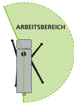
Eingeschränkter Arbeitsbereich bei einseitigem Aufbau